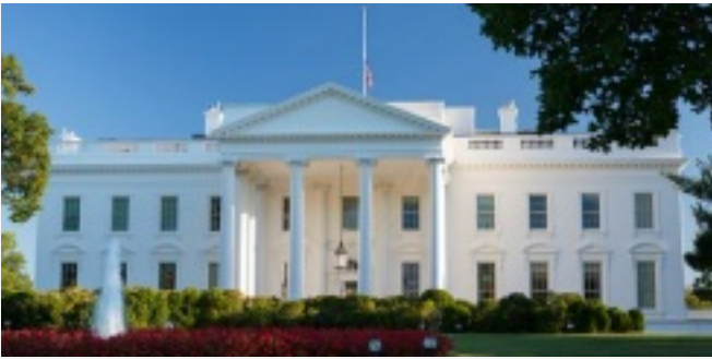
Das Weiße Haus