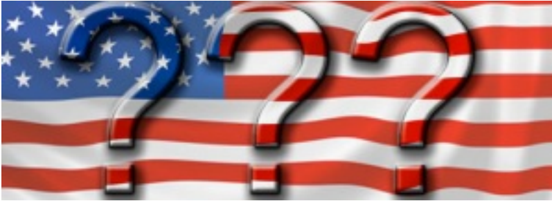
Flagge USA mit Fragezeichen.

Auf dieser Seite veröffentlichen wir häufig gestellte Fragen und Antworten zur der Präsidentschaftswahl in den USA 2016. Dies sind keine rechtsverbindlichen Auskünfte, dennoch hoffen wir, dass wir Ihnen mit diesen Informationen weiterhelfen können.